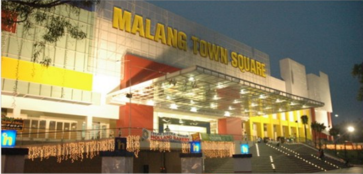
Malang Town Square