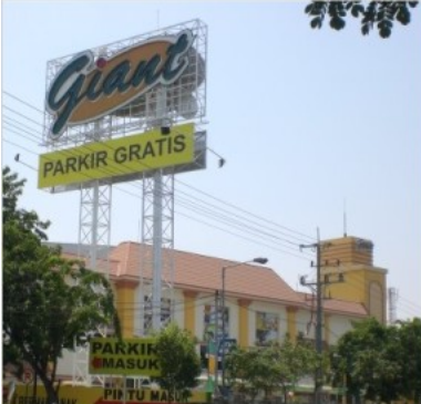
Giant Diponeoro Surabaya