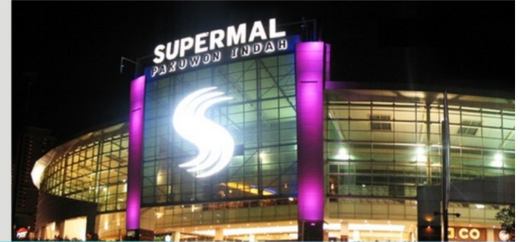
Supermal Pakuwon Indah