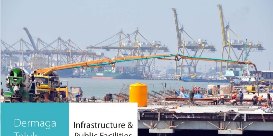
Dermaga Teluk Lamong