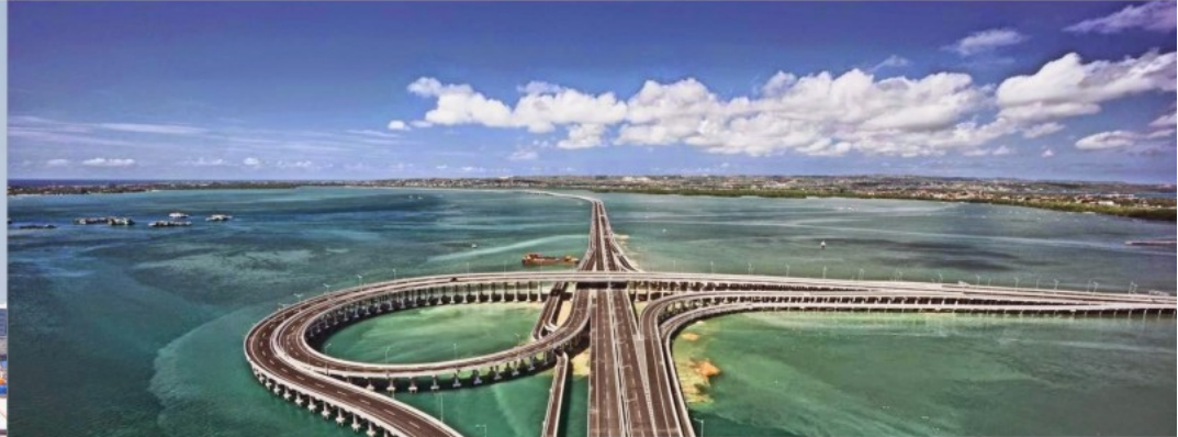
Tol Tanjung Benoa, Bali