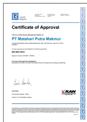
Sertifikat ISO 9001:2015