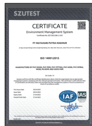
Sertifikat ISO 14001:2015 (OHSAS)