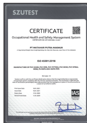
Sertifikat ISO 45001:2018 (OHSAS)