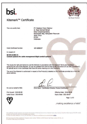
Sertifikat BSI Pipa dan Fitting Trilliumvolta