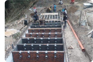
Trilliunshield @Proyek Sanitasi Lingkungan Berbasis Masyarakat Lumajang (Jatim)