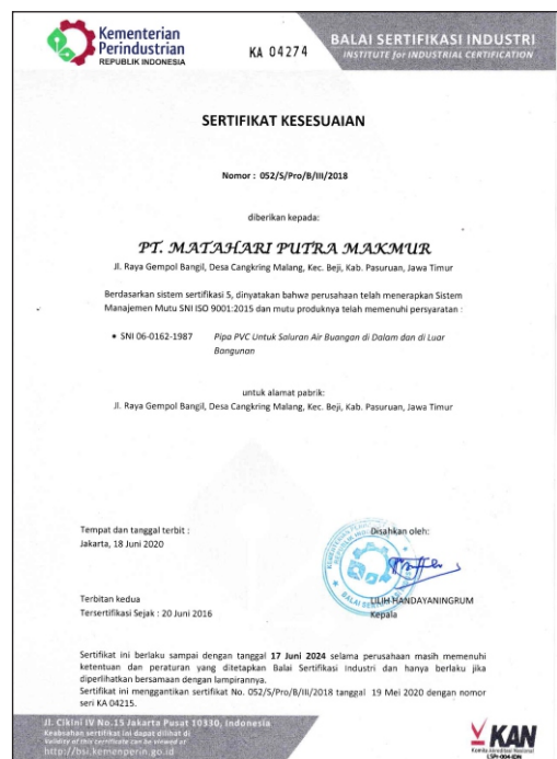
Sertifikat SNI - Pipa Trilliumshield