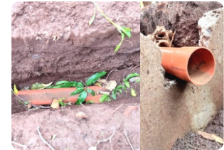
Trilliunshield @Proyek Instalasi Saluran Limbah Banjarmasin (Kalsel)