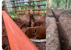
Trilliunshield @Proyek Jambanisasi Probolinggo (Jatim)