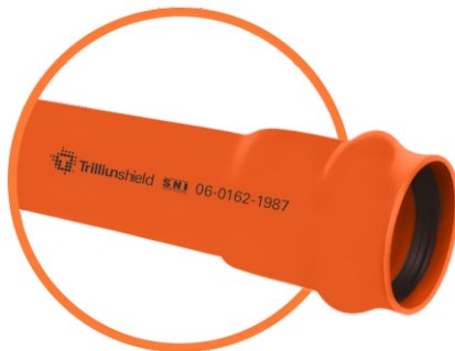
Rubber Ring (RR)