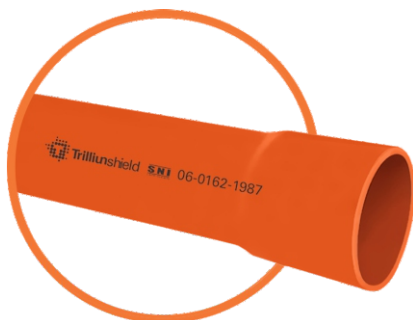
Solvent Cement (SC)