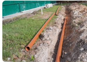
Trilliunshield @Proyek Instalasi Saluran Limbah (Bangka Belitung)